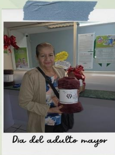
Día del adulto mayor