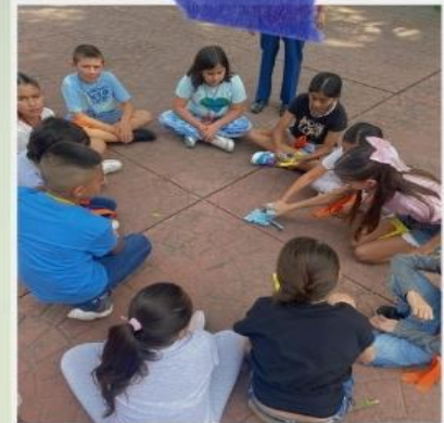
Cursos de verano