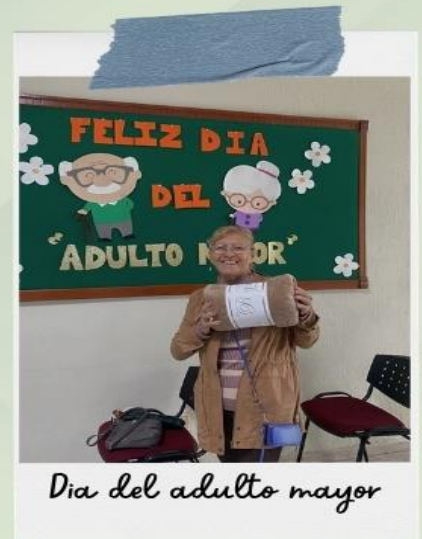
Día del adulto mayor