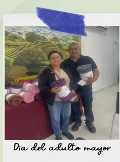
Día del adulto mayor