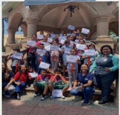
Cursos de verano