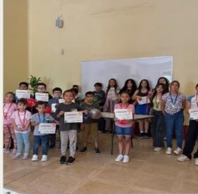
Cursos de verano